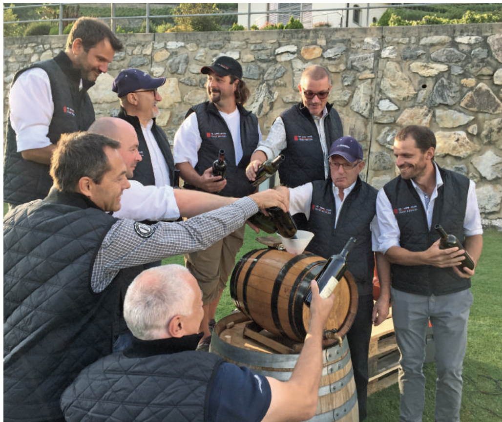
Une douzaine de vignerons réunis autour d'un tonneau commun.

Mine de rien, une fois toutes leurs parcelles de vignes assemblées, l'Association atteint les 200 hectares. « Elles se situent entre 850 et 1000 mètres et on doit ainsi se classer parmi les plus importantes