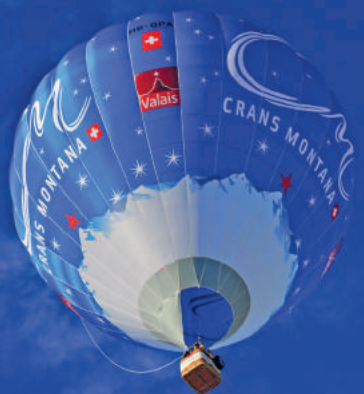
Après deux ans d'absence, les montgolfières reviennent à Crans-Montana. C.M.T.C BRUNO PETRONI

de la nature et du panorama exceptionnel. Enfin, je terminerai la journée par un bon repas servi avec un excellent cru de nos villages.