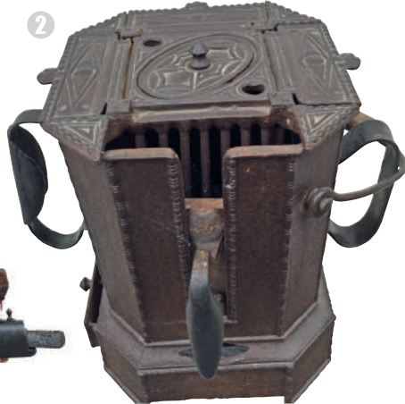
2 - Impressionnant, le fer à repasser Marty!