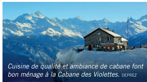
Cuisine de qualité et ambiance de cabane font bon ménage à la Cabane des Violettes. DEPREZ