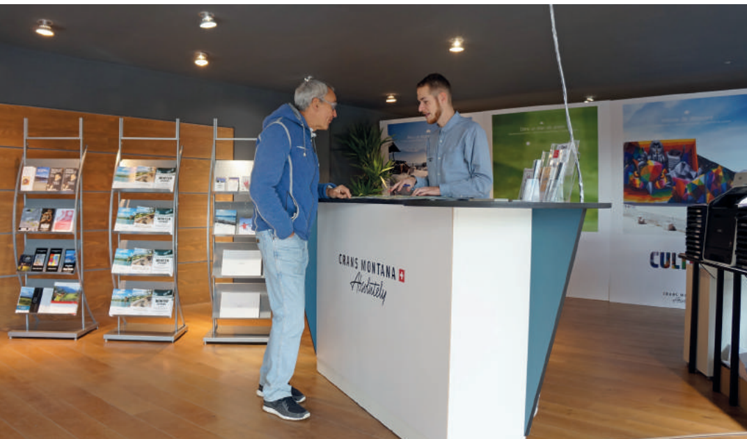
À la rue du Prado 29, l'Office du tourisme occupe des espaces conviviaux et bien placés.

Crans-Montana possède deux bureaux d'information: le premier à l'avenue de la Gare, le second à la rue du Prado. À l'heure où tout se trouve sur internet, l'Office du tourisme devient une «boîte à idées».