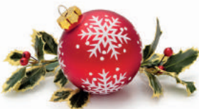
CMTC DENIS EMERY

Le programme des festivités de Noël est varié et complet sur les six communes de Crans-Montana.