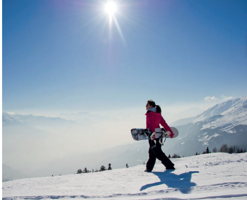
Le domaine skiable de Crans-Montana offre un paysage inoubliable à travers ses 140 km de pistes balisées exposées plein sud.

À LA PAGE | VU D'EN HAUT | VOUS ET NOUS | ENSEMBLE | DÉCLICS