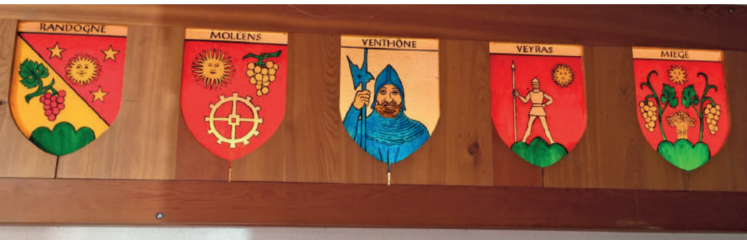
Les armoiries des cinq entités de la Grande Bourgeoisie de la Noble Contrée.

Après la fusion des communes, pourquoi ne pas fusionner les bourgeoisies? La question a été posée. Elle a fait l'objet d'un refus très net des bourgeois de Mollens, Randogne, Montana et Chermignon. C'est que la bourgeoisie rattache les habitants à leurs racines. Tour d'horizon.