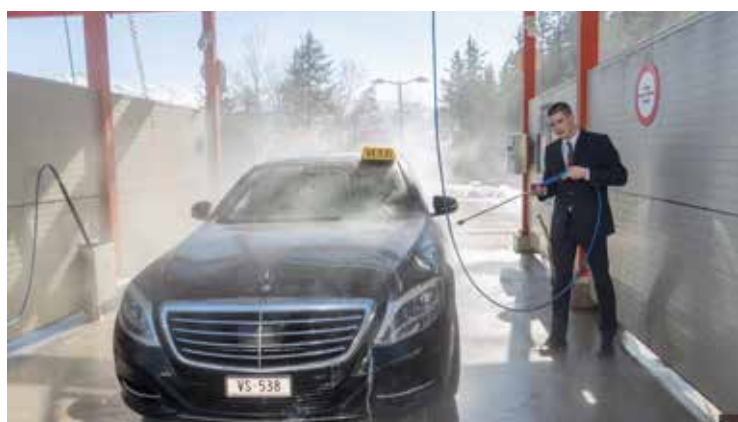
Pour assurer le « service de haute qualité » exigé par l'ACCM, il convient d'avoir des voitures impeccables.