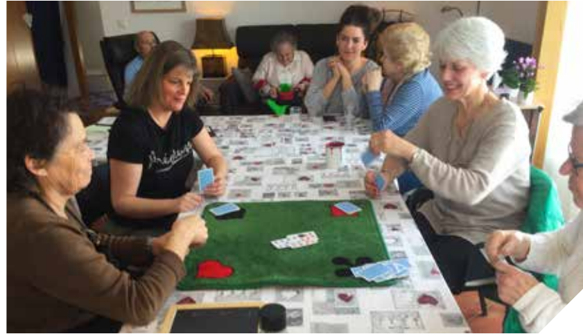
Le plaisir d'une partie de jass. En plus, bon pour la mémoire.