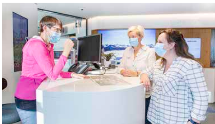
Les espaces d'accueil offrent des conseils personnalisés.