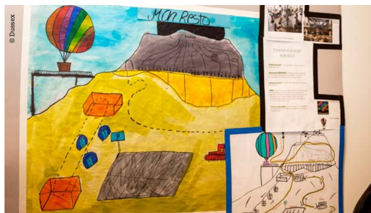
L'un des vingt-deux projets présentés : un restaurant accessible en montgolfière.