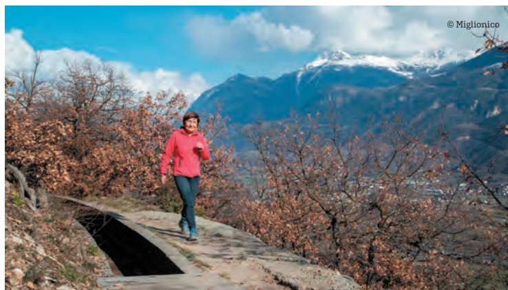
Promenade bucolique, à flanc de coteau sur le bisse du Sillonin. La destination a développé un tourisme quatre saisons qui porte ses fruits.