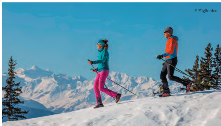
Pour tous les âges et tous les goûts, la région de Crans-Montana offre de quoi s'activer dans la neige, à pied, en raquettes, en skis, en luge...

Icogne à l'embouchure de la Lienne. Vous pouvez aussi, au travers d'une zone rocheuse très vertigineuse, rejoindre le bisse de Clavau qui domine St-Léonard. De splendides points de vue s'offrent à votre regard.