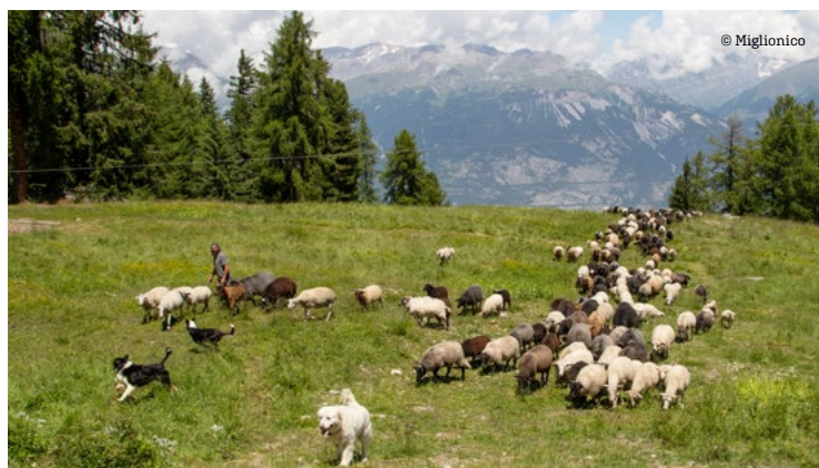
D'autres chiens jouent un rôle capital pour les bergers. Ce sont les Border Collies qui guident le troupeau. Les chiens blancs protègent, les autres conduisent: à chacun sa mission.

fraternité avec les animaux. Cet amour des moutons, chèvres et chiens, saute aux yeux du visiteur. Un sifflement, un appel et c'est tout un troupeau qui surgit du fond de la forêt, avec les chiens qui s'activent à guider les bêtes... Spectacle magique qui démontre le savoir-faire et la complicité du berger avec ses protégés.