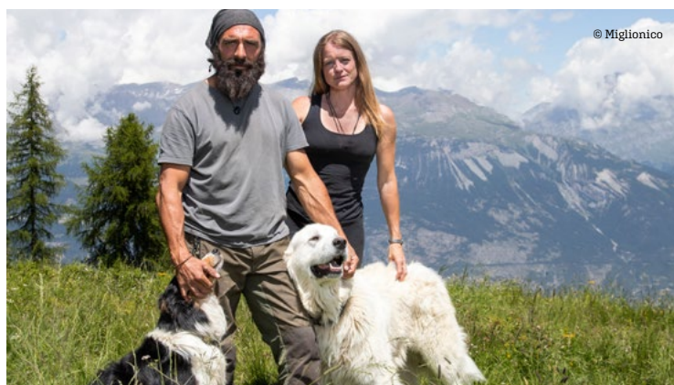
Bel échange: «Nous faisons vivre le troupeau et le troupeau nous fait vivre» , affirment nos bergers.