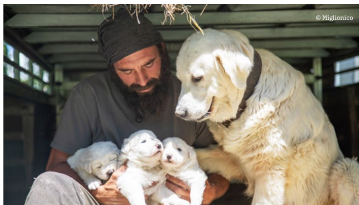
Palina a mis bas trois chiots, ravissantes petites boules de poils blancs. Ici dans les bras de l'éleveur.

Le métier de berger laisse peu de loisirs. Mais c'est une vie simple et saine, proche de la nature, en